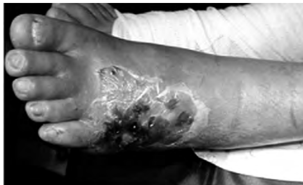
Figura 1. Pie diabético Wagner Tipo IV.

Acta ortop. mex 2014, vol.28, n.3, pp. 168-172